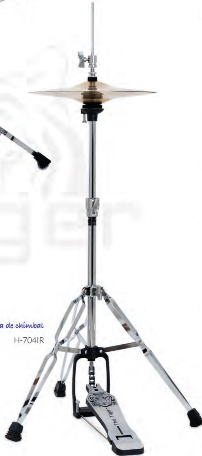
Máquina de chimbau H-704IR