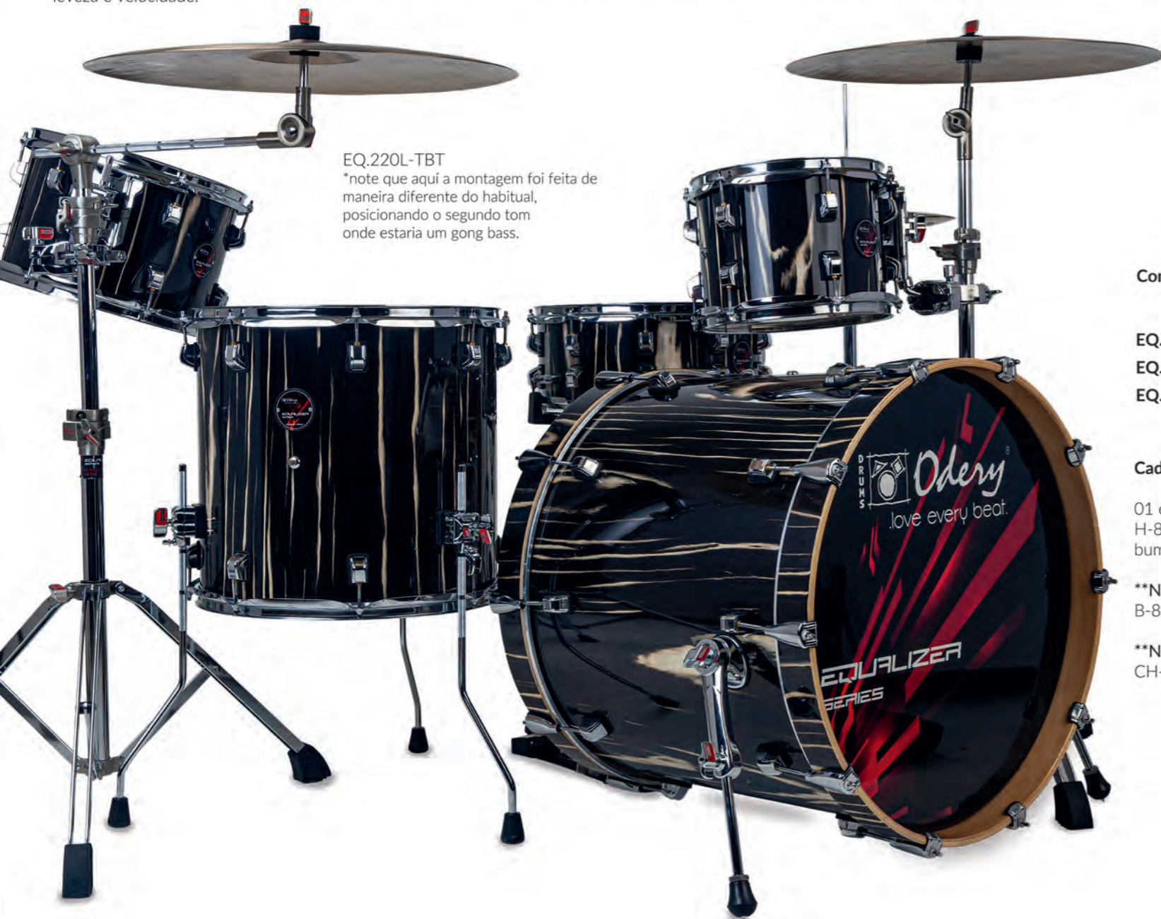
EQ.220L-TBT *note que aqui a montagem foi feita de maneira diferente do habitual, posicionando o segundo tom onde estaria um gong bass.

As ferragens da linha Equalizer incluem pés com hastes paralelas e duplas, além de regulagens diversas, para atender a toda e qualquer situação em palco ou estúdio. As junções seguem o novo conceito Odery, com acabamentos em aço escovado e aplicações da cor vermelha nos detalhes, além de memórias em todos os estágios de ajuste. A linha de ferragens conta com estantes nos modelos reta e girafa, extensor girafa para pratos, máquina de chimbau, estante de caixa e pedais, nas versões simples e duplo (inclusive para canhoto). Os pedais Equalizer têm um visual totalmente agressivo, com um desenho moderno e de muito estilo, agregado aos recursos para oferecer precisão, leveza e velocidade.