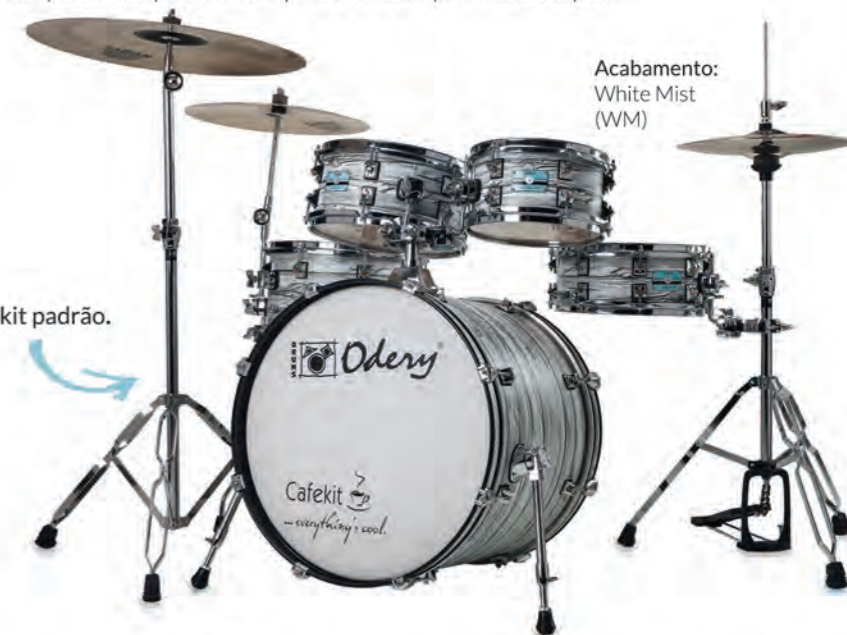
Acabamento: White Mist (WM)

Confira acima o Cafekit, com o set expansivo adicionado. Note que os dois holders que fixavam os tons no kit compacto, foram acoplados ao surdo, e que agora servem também como holder para um cowbell e para mais um prato - apenas como sugestão. Você pode usar como melhor lhe convier, adicionando um instrumento de percussão, um prato splash, ou outro acessório de seu interesse.