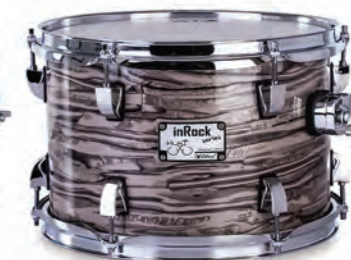
Lunar Tiger (LT)

Tambores avulsos, disponíveis nas seguintes medidas: