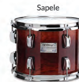
Sapele Explosion (EX)