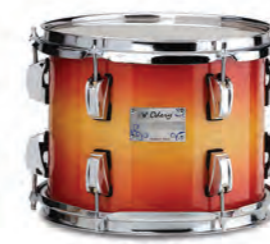
Soft Cobre (SC)