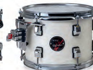
Lunar Waves (PLW)