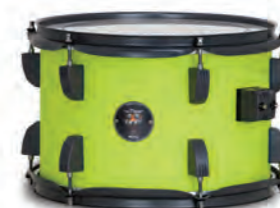
Sicilian Lemon (SLGR)

Acompanha : Estante reta C-604TG, Máquina de chimbau H-604TG, Pedal de bumbo P-604TG, Suporte de caixa S-604TG, Banco T-604TG e tom holder duplo. Também disponível com prato Ride de 18" e chimbau de 13", além de par de baquetas.