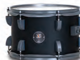
Matte Black (MBGR)