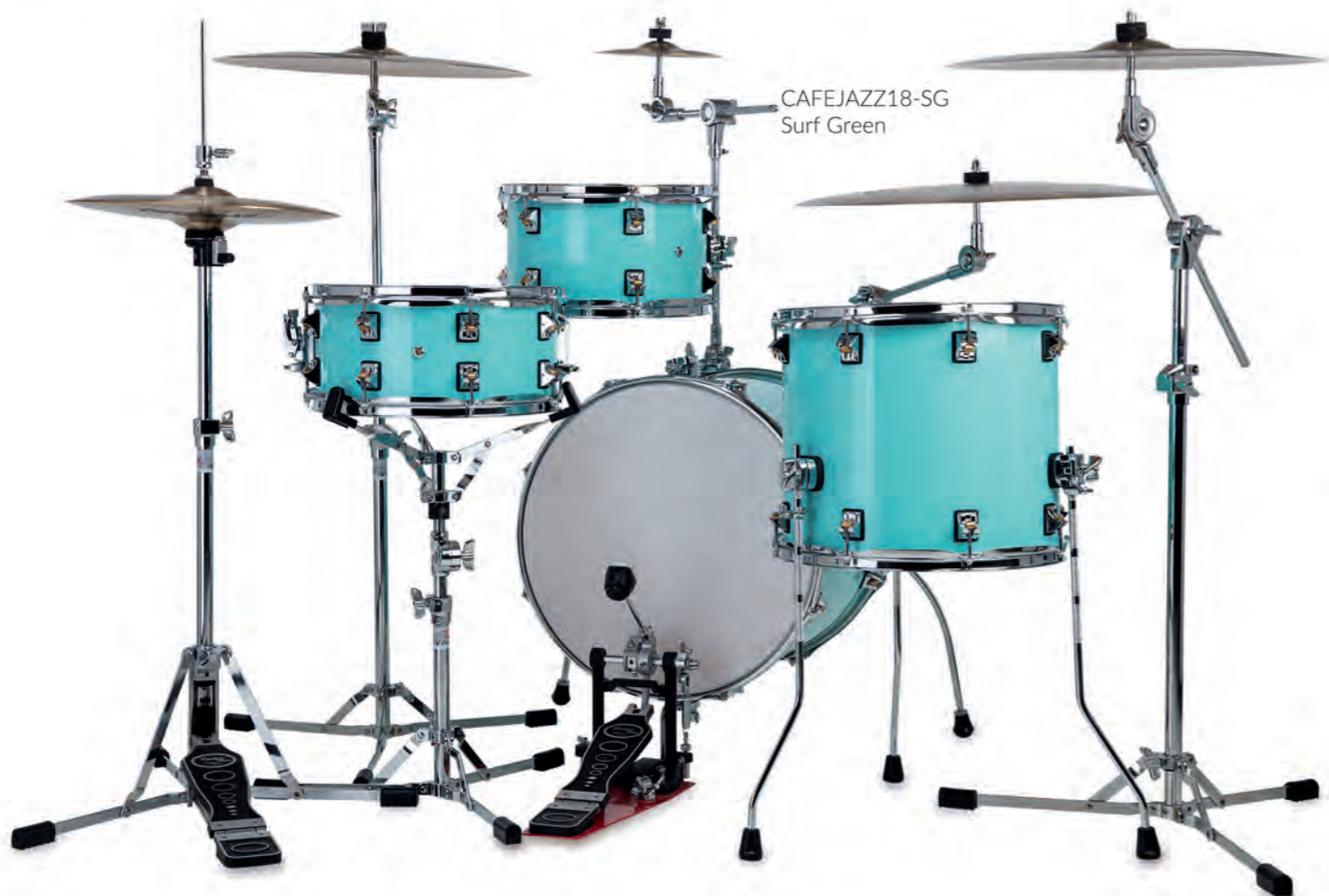
CAFEJAZZ18-SG Surf Green

Todos os acabamentos são em PVC, de alto padrão, e assim como nas séries Cafekit e inRock, são inteiramente colados ao casco, o que garante maior durabilidade do instrumento, evitando descolamentos e bolhas.