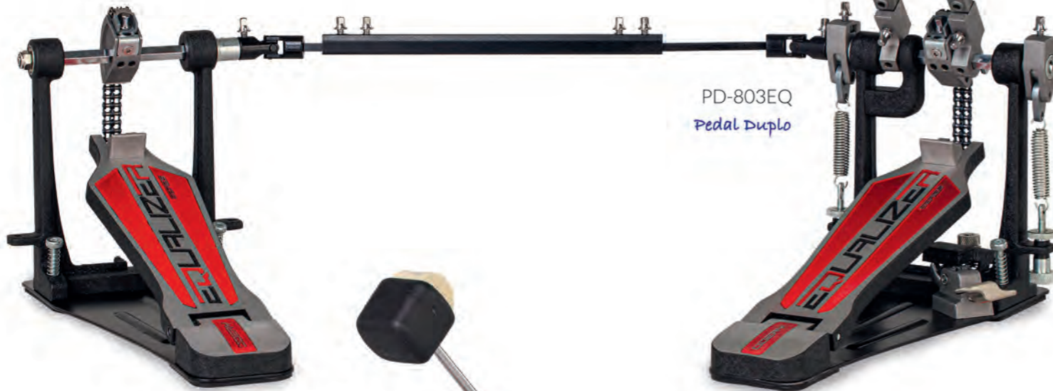
PD-803EQ Pedal Duplo

As estantes de pratos Equalizer contam com pés duplos paralelos, junções tipo abraçadeira – que fixam os estágios em posição, sem a necessidade de esforço excessivo no aperto – e com memórias, para garantir a facilidade e agilidade de posicionamento durante a montagem. Com tubos espessos, são extremamente confiáveis, e suportam de forma estável, qualquer medida (e peso!) de prato, mesmos os maiores formatos, como os de 24".