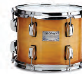
Soft Gold (SG)