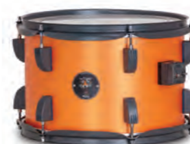
Metal Orange (MOGR)