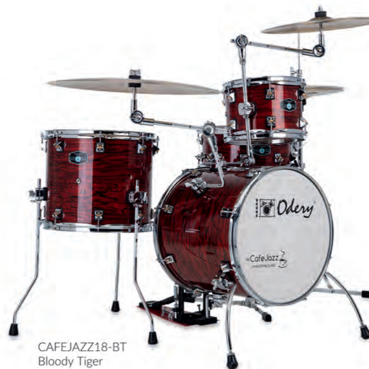
CAFEJAZZ18-BT Bloody Tiger