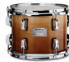
Imbuia Fade (IF)