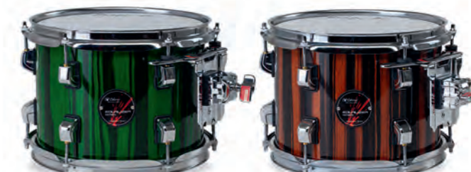
Emerald Green (EGT)