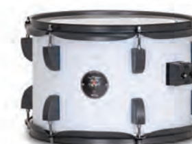
Matte White (MWGR)