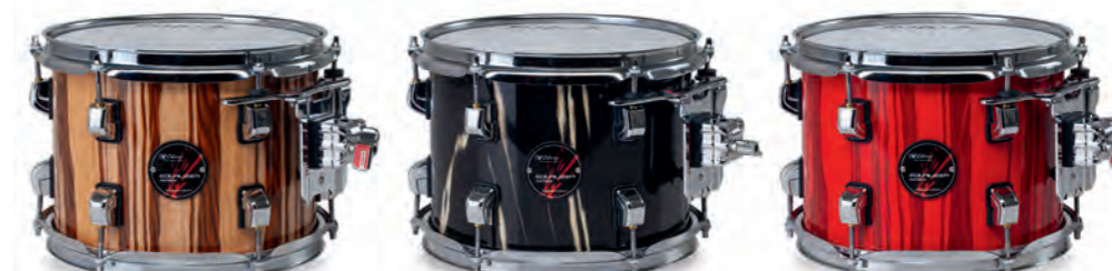
Natural Trees (PNT)