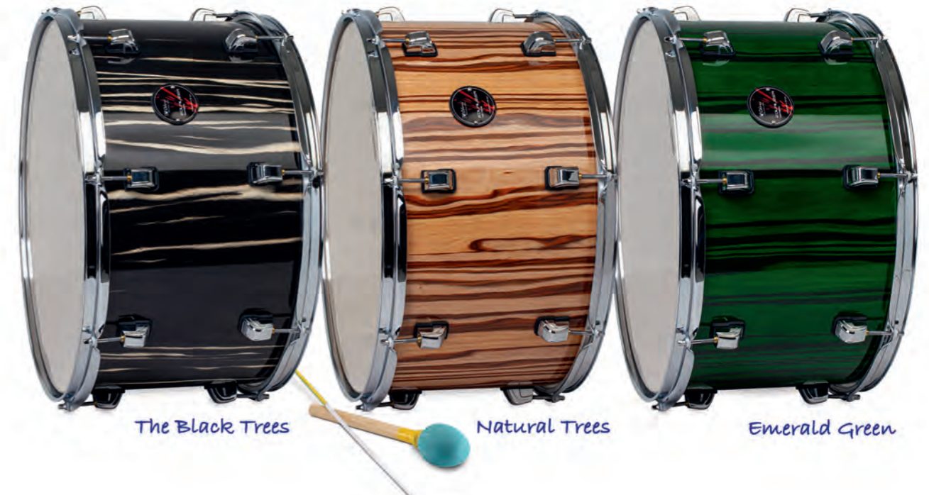
The Black Trees