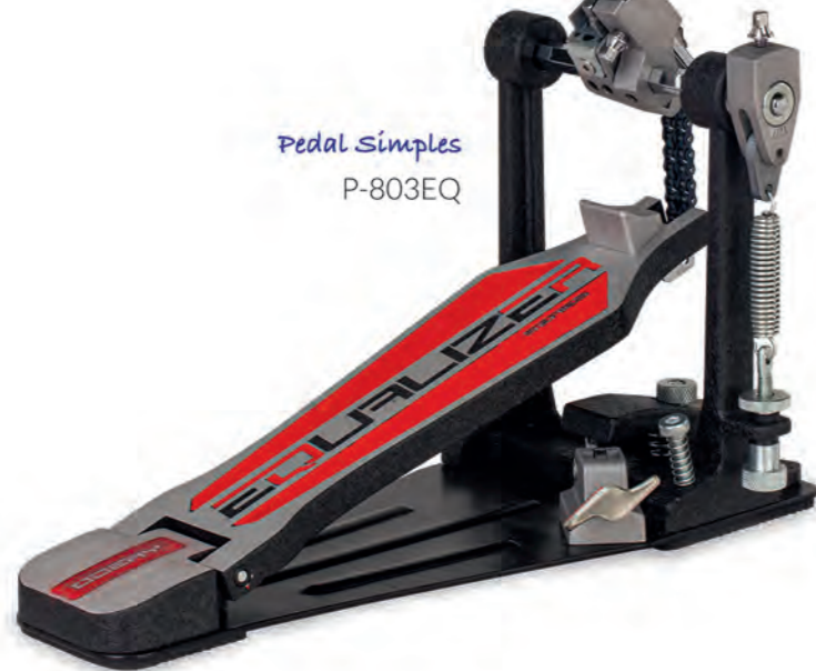
Pedal Simples P-803EQ