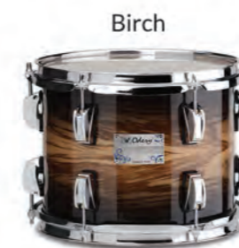
Tiger Black (TB)

Acabamentos disponíveis em outras madeiras: