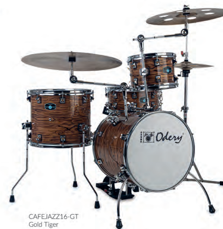
CAFEJAZZ16-GT Gold Tiger