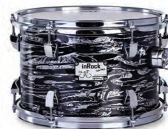
Dark Tiger (DT)