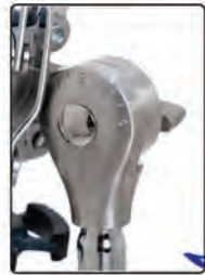
Regulagem de inclinação numerada