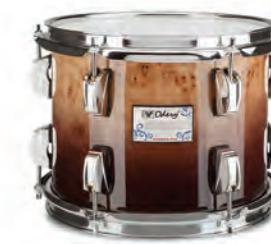
Mappa Burl (BF)

Acabamentos disponíveis em outras madeiras: