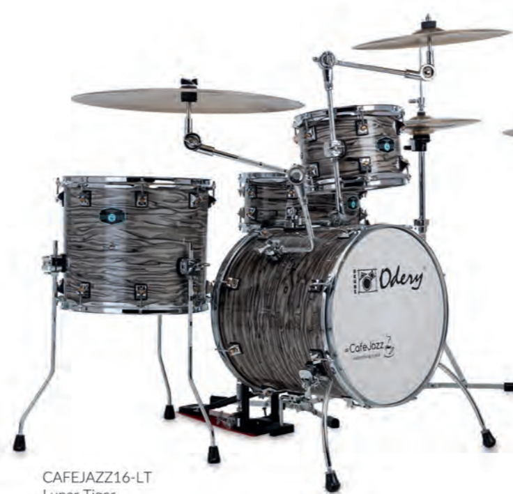
CAFEJAZZ16-LT Lunar Tiger

***não acompanha estantes de prato, suporte de caixa, pedal, banco e máquina de chimbau. O Cafejazz é vendido em shell pack.