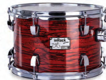
Bloody Tiger (BT)