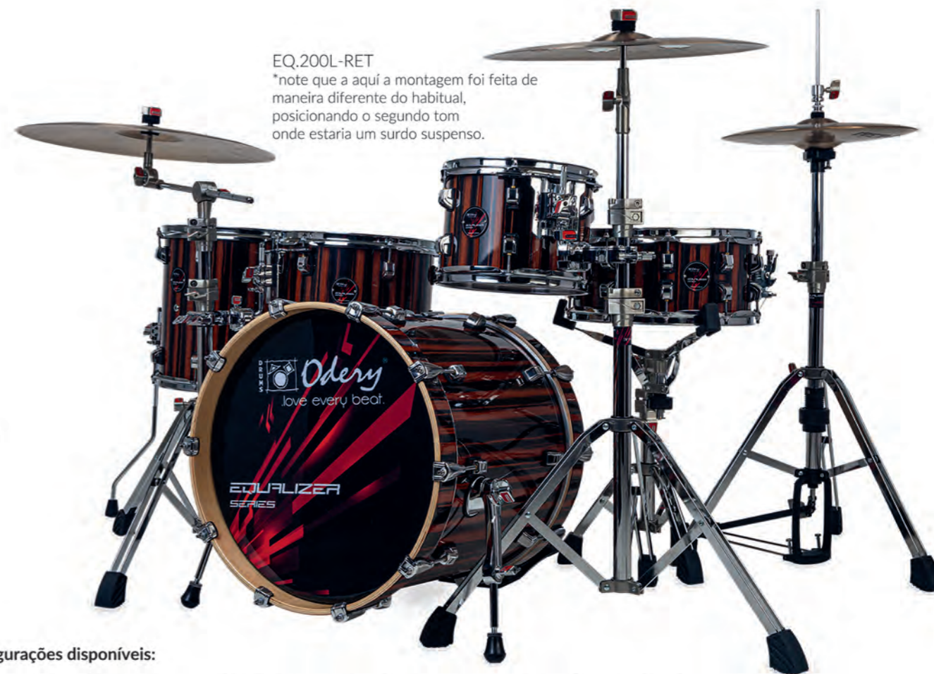
EQ.200L-RET *note que aqui a montagem foi feita de maneira diferente do habitual, posicionando o segundo tom onde estaria um surdo suspenso.