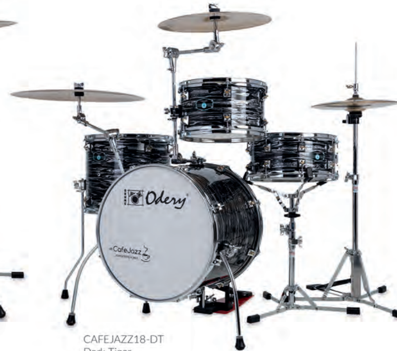
CAFEJAZZ18-DT Dark Tiger