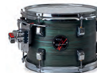
Green Ocean (DGO)