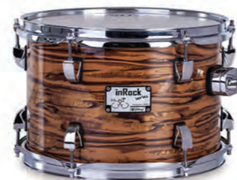
Gold Tiger (GT)

Acabamentos disponíveis além da Surf Green *página ao lado