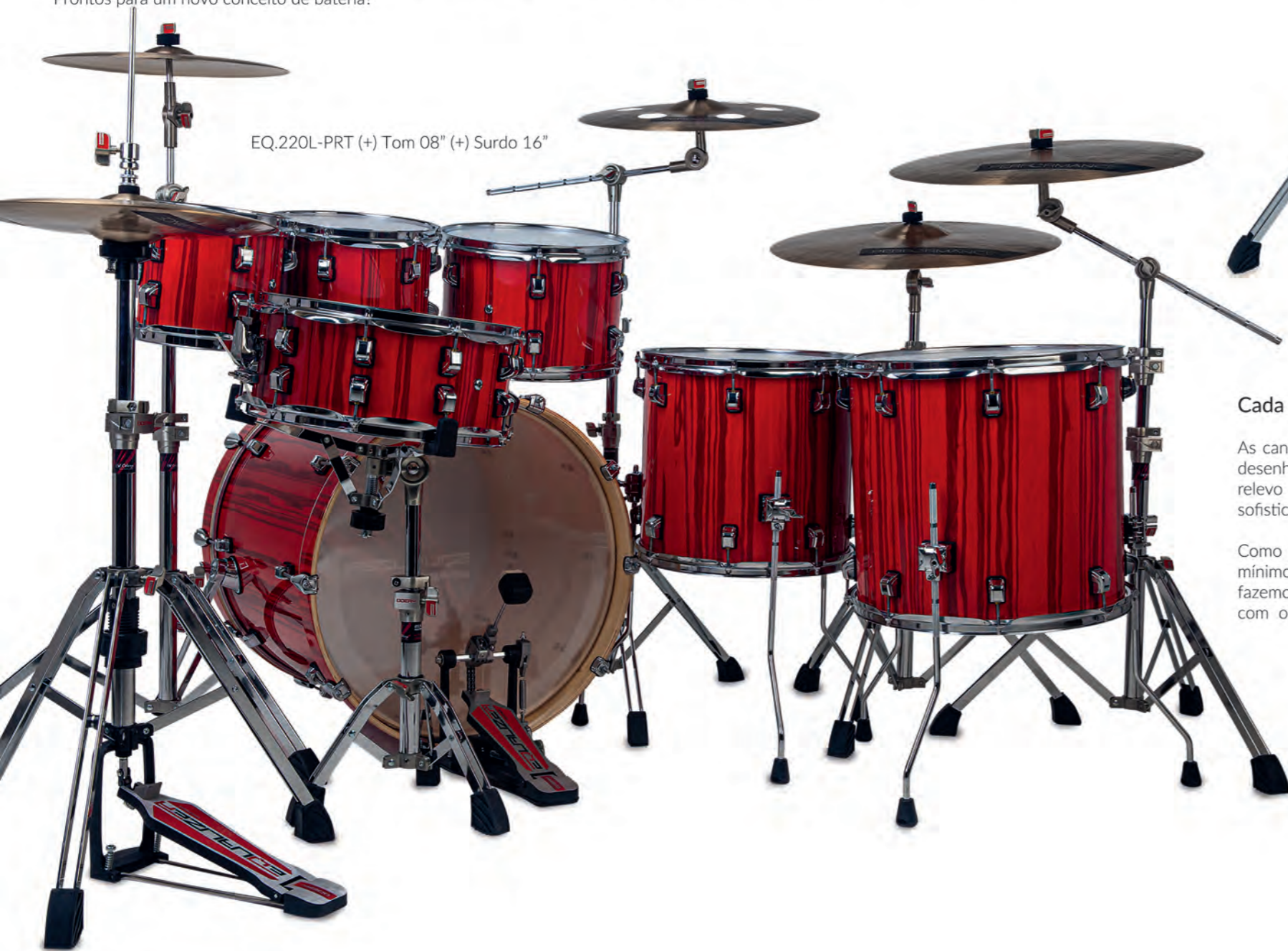
EQ.220L-PRT (+) Tom 08" (+) Surdo 16"

Para os acabamentos revestidos, utilizamos um PVC especial, de alta performance, que é 100% colado ao casco. Isso significa que nossos tambores revestidos oferecem maior durabilidade, e ao mesmo tempo evitam o aparecimento de bolhas quando expostos ao calor. A textura fosca aplicada nos tambores com acabamento revestido, agrega um toque de modernidade. Prontos para um novo conceito de bateria?