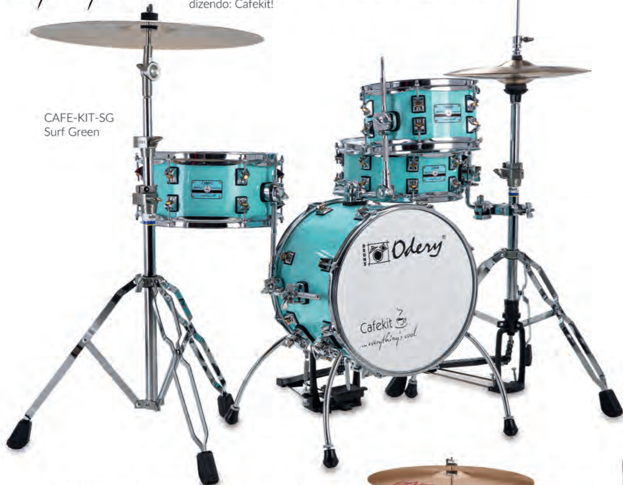
CAFE-KIT-SG Surf Green

Ficamos ainda mais empolgados, quando nos veio à cabeça a imagem de uma xícara de café, para compor o logo, unindo todos os elementos perfeitamente. O projeto estava pronto! O Cafekit foi projetado inicialmente, pensando nos pequenos bateristas, ou seja, nas crianças a partir dos 2 anos, que geralmente ganham uma bateria infantil, de brinquedo, e quando crescem, deixam de tocar. Mas nosso projeto cresceu, e o Cafekit passou a ser um projeto também para os adultos. É um kit completo, utilizável por bateristas de todas as idades, dos 5 aos 50 anos. Ele oferece a possibilidade de acoplar um kit expansivo, e ser convertido em 'kit normal'. Rapidamente o kit se tornou um produto de sucesso, uma 'febre' entre os bateras, que além de seu kit usual, o utilizam como kit de apoio para gigs em palcos pequenos, ou até mesmo para ter em casa, em ambientes com espaço reduzido. Além de dar um toque especial ao ambiente, também como objeto de decoração, tem um baita som!