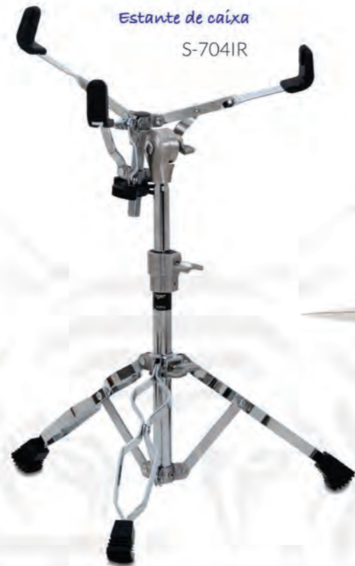
Estante de caixa S-704IR