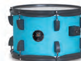
Matte Sky (MSGR)